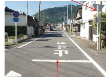
【停止線(実線)】標識あり