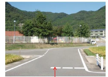
【指導停止線(破線)】標識なし