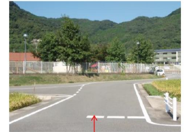
【指導停止線（破線）】標識なし