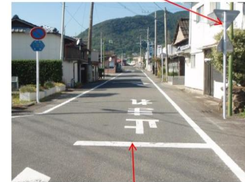
【停止線（実線）】標識あり